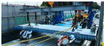
床版架設機による分割した床版取替