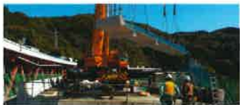
大型クレーンによる全断面床版取替