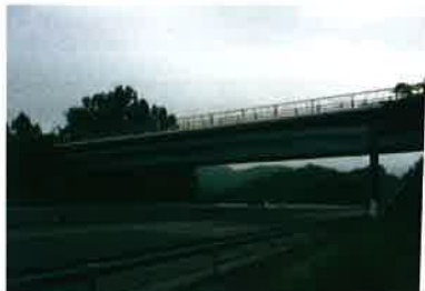
撤去する上の久保(かみのくぼ)橋