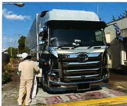
取締基地における取り締まり