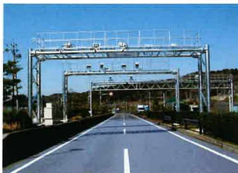
車両重量自動計測装置による計測